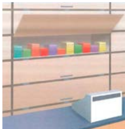
Ouverture d'un compartiment dont la surface est réduite