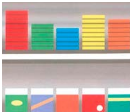
Rangement des produits sans effet promotionnel à l'intérieur du compartiment