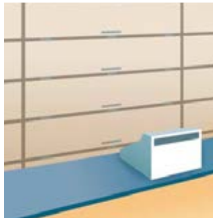
Dispositif de rangement fermé comportant plusieurs compartiments