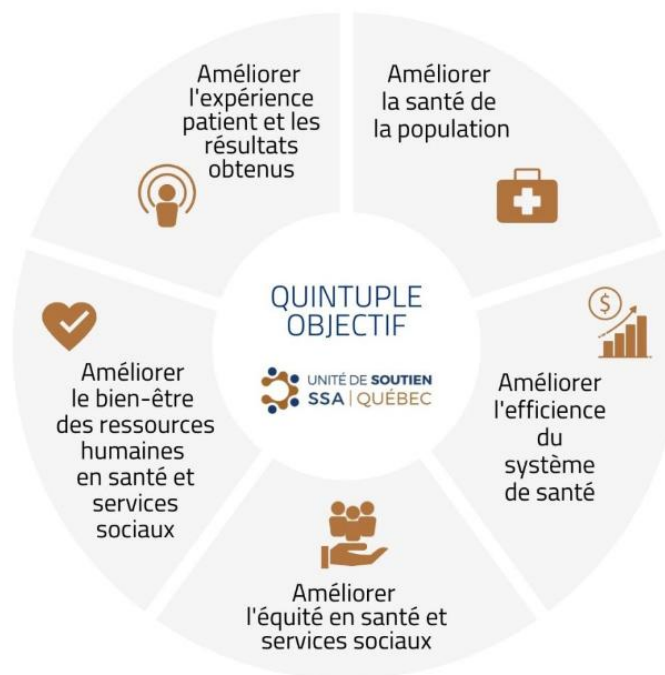
Figure 3 — Le quintuple objectif 11

L'ACQ, dans les soins de santé, est une approche fondamentale pour des soins primaires de qualité. Elle combine, avec rigueur, la pratique réflexive, l'application des meilleures pratiques, l'analyse des données et le travail d'équipe. L'approche se caractérise aussi par le développement d'une culture qui amène tous les acteurs impliqués à faire preuve d'une approche systémique et réflexive pour repérer des occasions d'amélioration.