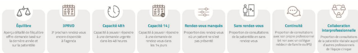
Figure 2. Indicateurs du tableau bord sur la première ligne ORAA+

Les GMF qui souhaitent obtenir ce rapport personnalisé peuvent en faire la demande par l'entremise du lien suivant : https://forms.gle/SmYDNcJ8ZaUcYjtq7 .