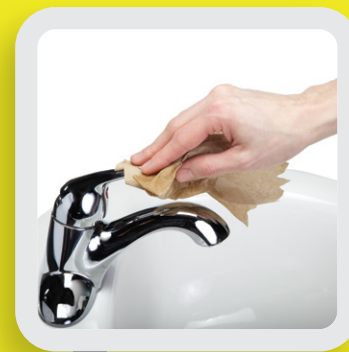
7 FERMER AVEC LE PAPIER