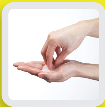
4 NETTOYER LES ONGLES