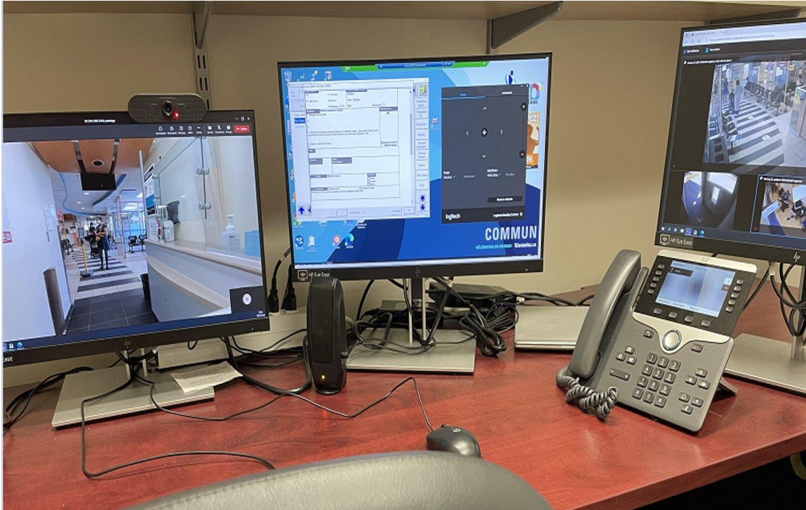
CHU de Québec – Université Laval, Centre hospitalier de l'Université Laval