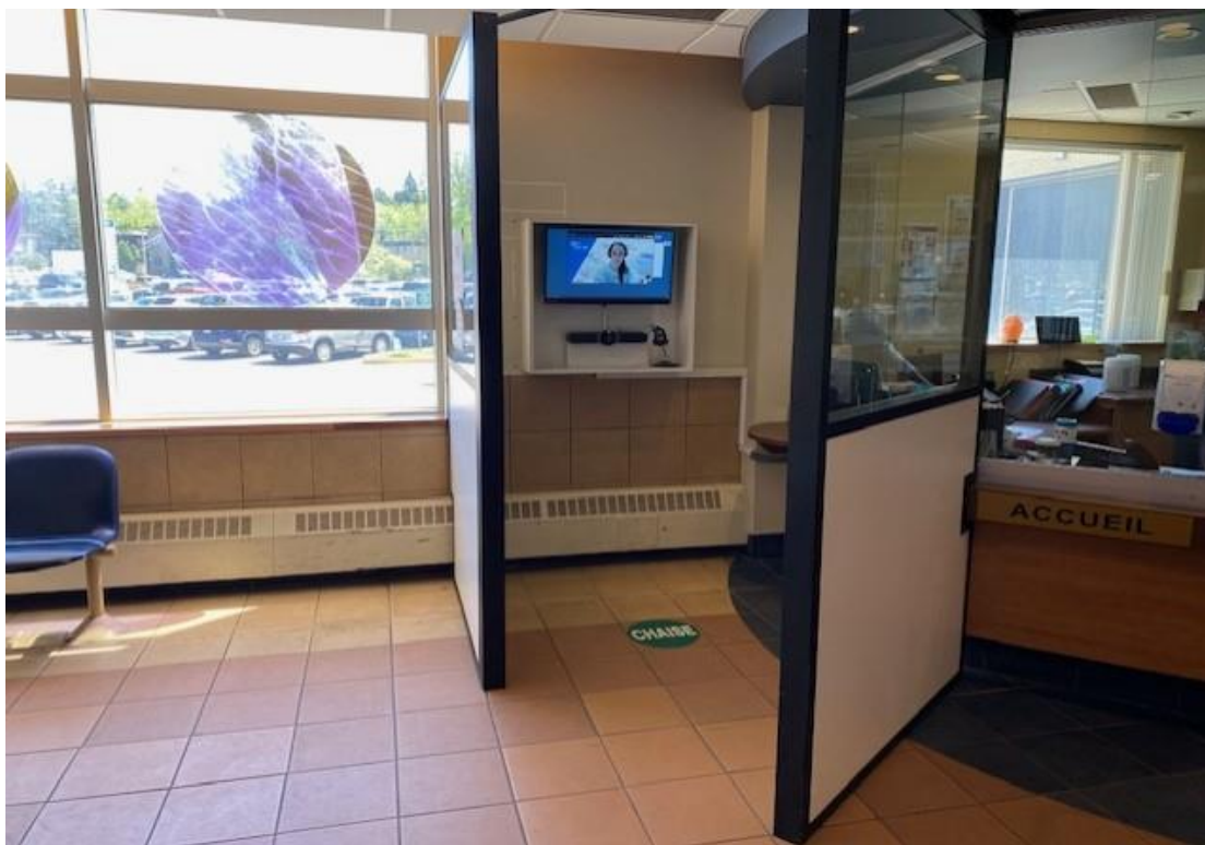
CIUSSS Saguenay–Lac-Saint-Jean, Urgence de Chicoutimi