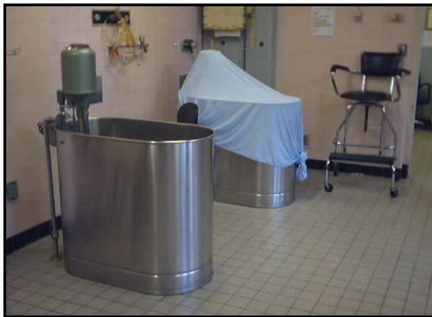
Bain tourbillon pour les membres