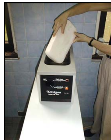
Bloc de paraffine