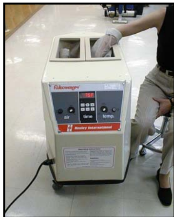
Appareil de fluïdothérapie

Un substrat de cellulose (grains de maïs pulvérisés) mis en suspension dans l'air par un système de soufflerie remplace l'eau des bains tourbillons traditionnels. Le substrat de cellulose est constitué de grains de maïs pulvérisés (Valenza 1979). La force du jet d'air ainsi que la température peuvent être ajustées pour assurer au patient un confort optimal. La température peut varier de 37 °C à 54 °C et demeure constante tout au long du traitement grâce à un thermostat intégré à la cuve de l'appareil. Cette chaleur sèche constante compenserait le désavantage lié à la déperdition de chaleur rencontrée avec les autres modalités de chaleur humide utilisées en hydrothérapie. L'unité de traitement est mobile et n'est reliée à aucun système de plomberie. Elle offre ainsi l'avantage de permettre l'administration du traitement dans n'importe quel lieu physique (Hecox 1994, Fiche technique Henley International).