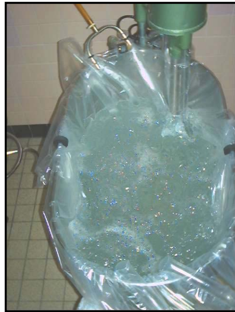
Membrane de plastique jetable dont les deux tuyaux sont reliés à une prise d'air murale