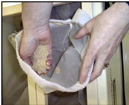
Grains de maïs pulvérisés