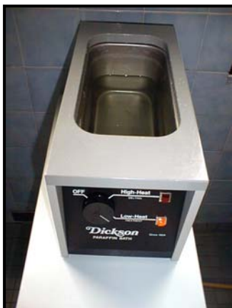
Bain de paraffine fixe en métal