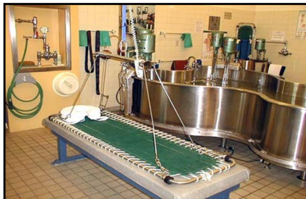
Civière utilisée pour les bains Hubbard