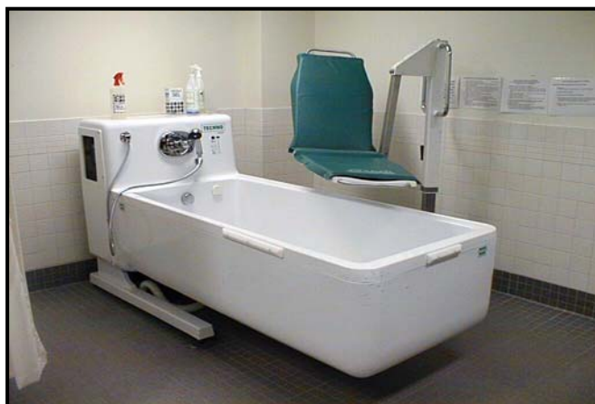
Baignoire avec hydromassage

Selon les types de baignoires, on distingue des équipements à hauteur fixe ou à hauteur variable. Les baignoires à hauteur fixe ont en général une base libre permettant l'accès du lève-personne sur trois côtés. Les baignoires à hauteur variable sont disponibles en deux options de levage, soit avec activateur électrique soit avec système à vérin hydraulique. Les systèmes électriques ont l'avantage du moindre coût, alors que les systèmes hydrauliques ont pour avantage une meilleure fiabilité (Fiche technique Techno-Medic 1996).